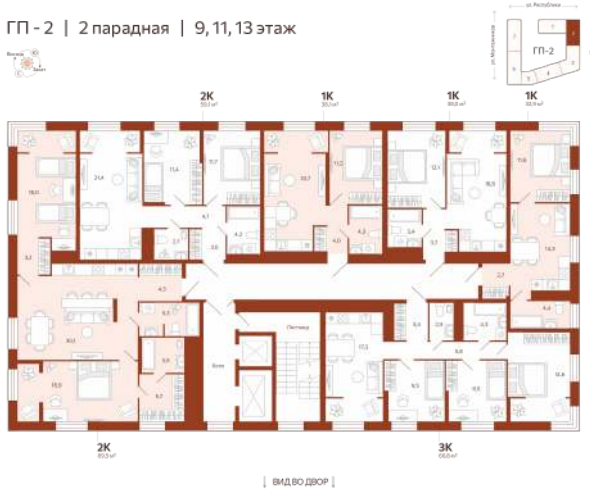
| вид во двор |