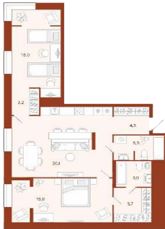
2К 63,5 м²