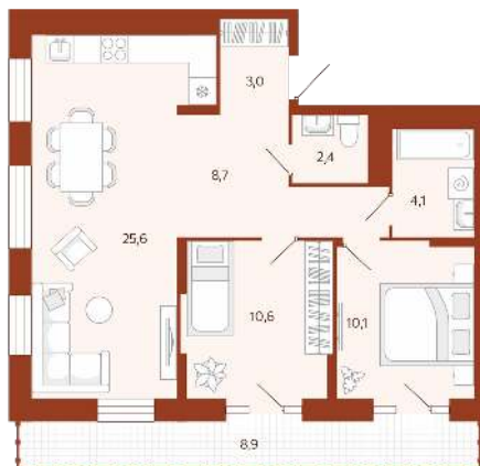
2К 64,4 м² Терраса + 8,9