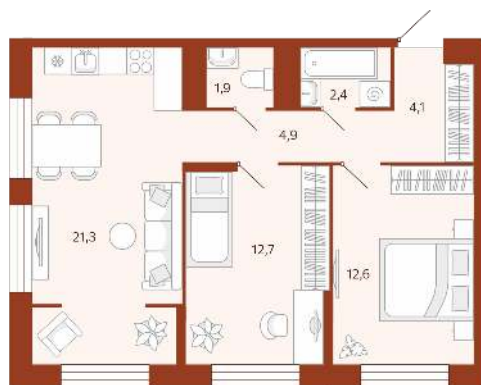
2К 59,8 м²